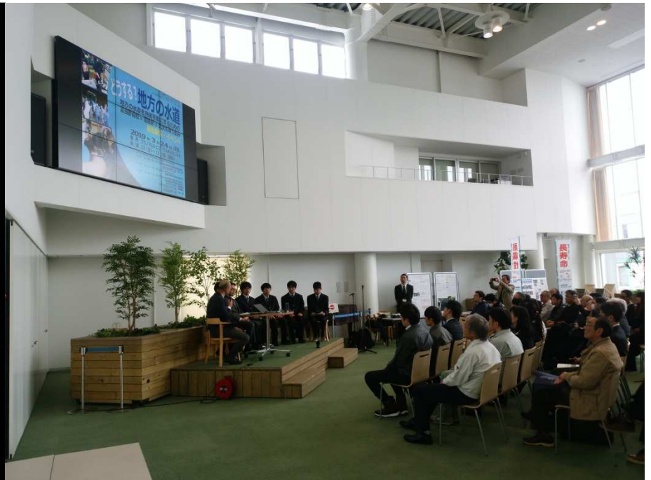
報告展示会の様子-1